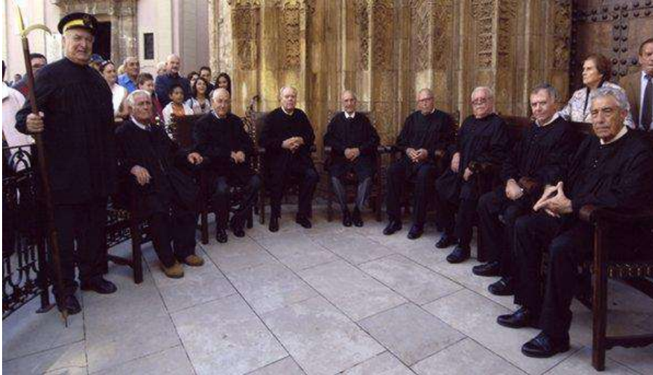
Slika 5: Sud

U Valenciji je odgovoran Vodeni sud Vega València. Sastoji se od osam sudaca (sindicosa), koje su demokratski imenovali vlasnici zemlje Horte iz Valencije, koji imaju pravo navodnjavanja između sebe. Sudom predsjedava predsjednik (sindico presidente), koji se bira između sindicosa i pomaže mu tajnik. Sud je odgovoran za pravednu raspodjelu vode među vlasnicima poljoprivrednih zemljišta, za rješavanje sporova između vlasnika zemljišta o pravima navodnjavanja i izricanje sankcija u slučaju kršenja običajnih zakona navodnjavanja. Članovi mogu biti samo poljoprivrednici s punim radnim vremenom. Sud se sastaje tjedno i odmah donosi presude za koje ne postoji pravo žalbe. 206