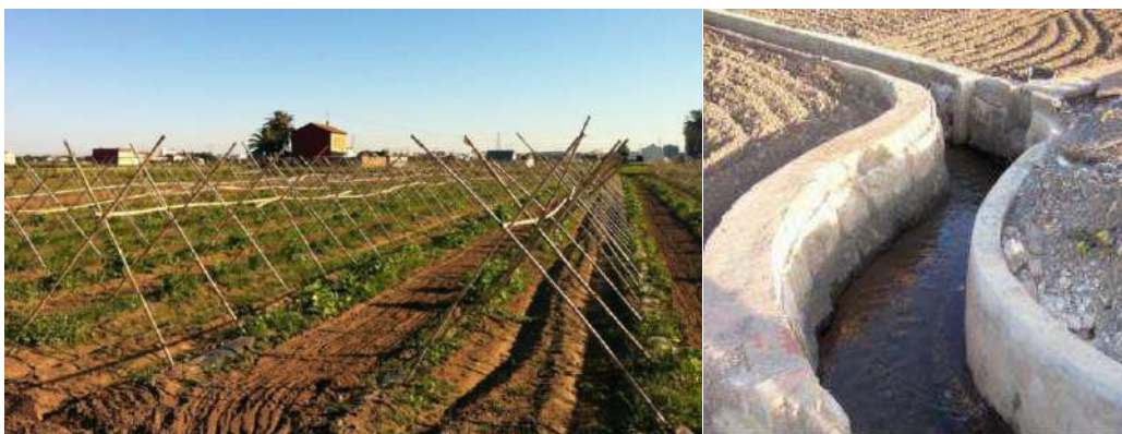
Slika 4: Upravljanje navodnjavanjem sustavom Horte

Vodeni sud Vodene zemlje Vega València jedna je od najstarijih pravosudnih institucija u Europi. Njegova prevladavajuća struktura potječe od Moora, oko 960. godine nove ere. Međunarodni vodeni sud Vega València i Vijeće dobrih ljudi Murcije prihvaćeni su člankom 125. španjolskog Ustava iz 1978. 204 kao sredstva javnog sudjelovanja u Pravosuđu. Na temelju toga članak 19. Organskog zakona o sudskoj vlasti 205 spominje ih među sudovima običajnog prava.